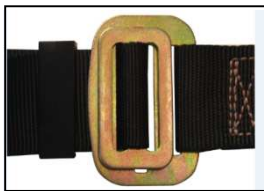
Cierre tipo pass thru